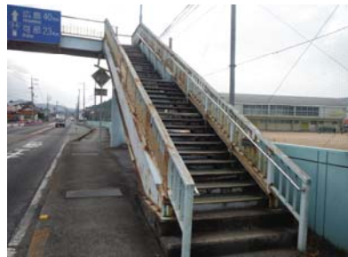
劣化の状況(階段部の腐食)