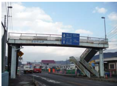
可愛横断歩道橋の現状