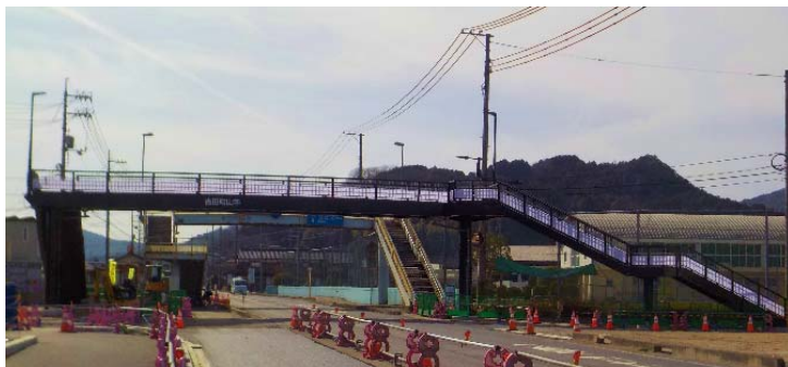
設置した新橋(松江側より撮影)