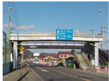
撤去を行う旧橋(広島側より撮影)