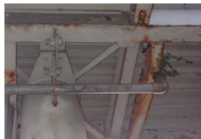
損傷の状況(階段部裏側の腐食)