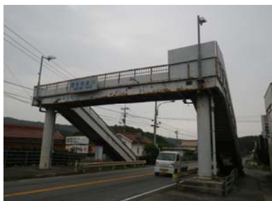
清河横断歩道橋の現状

※天候の状況や工事の進捗状況により、規制期間が変更となる場合があります。 ※現地の案内に従って、通行をお願いします。 ※再設置の際、改めて規制を予定しており、別途お知らせ致します。