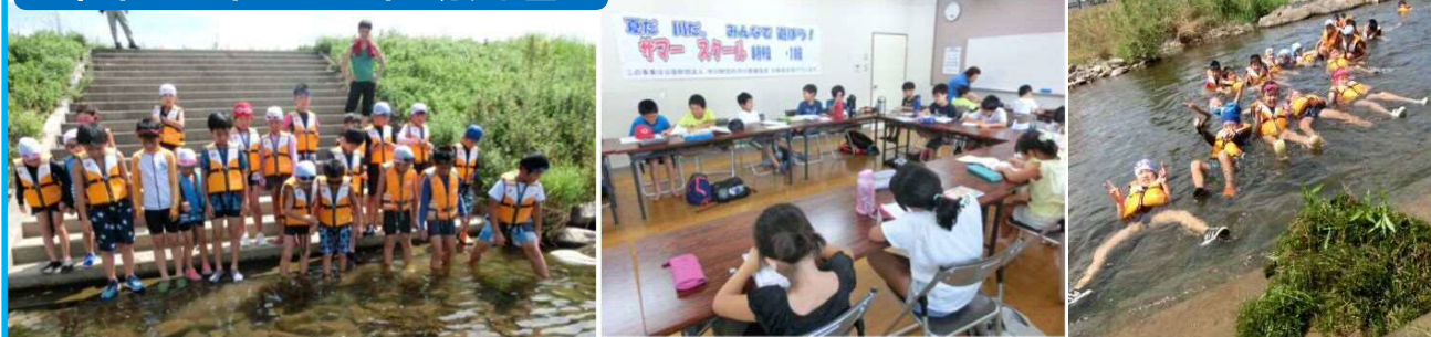
サマースクールの開催