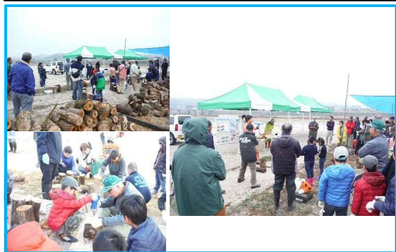
河川内の伐木を利用したキノコ植菌