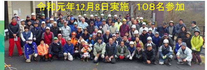
令和元年12月8日実施 108名参加