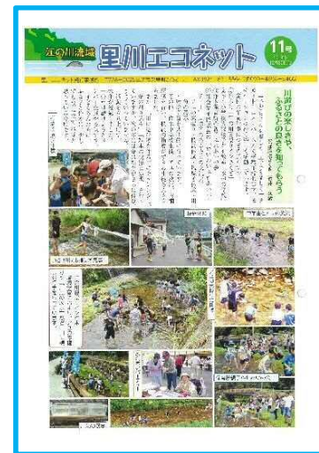
里川エコネット通信 発行