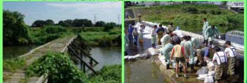
ビオトープの整備