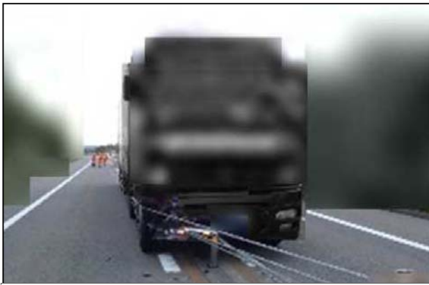
ワイヤロープにより、車線逸脱を防止