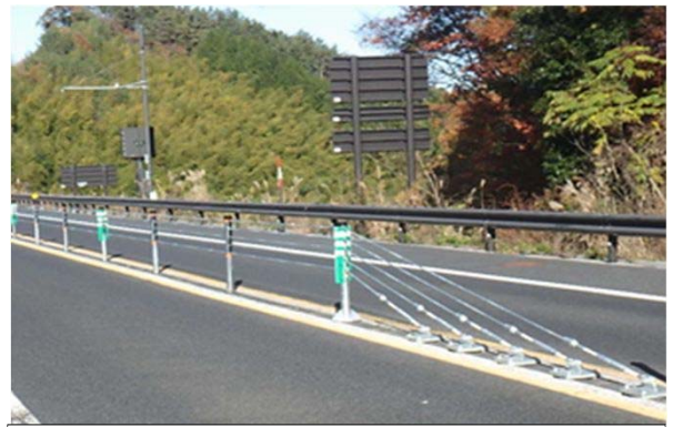
【設置後】松江自動車道(高野IC～雲南吉田IC)