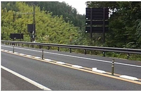
【設置前】松江自動車道(高野IC～雲南吉田IC)