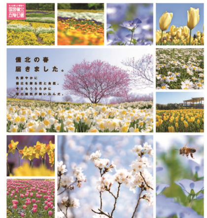
BIHOKU 2022 FLOWER PICNIC

約5,000㎡のピクニック広場に4月中旬から5月中旬にかけて、約120万本のネモフィラが咲き広がります。