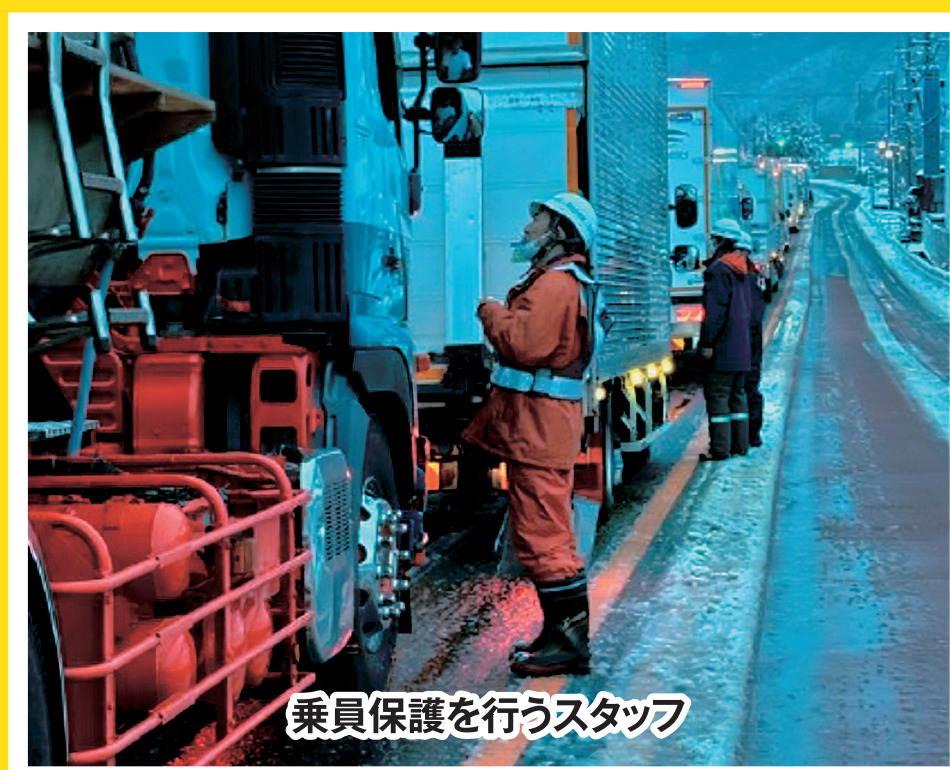
令和7年3月 山梨県内国道20号における 車両滞留の発生状況