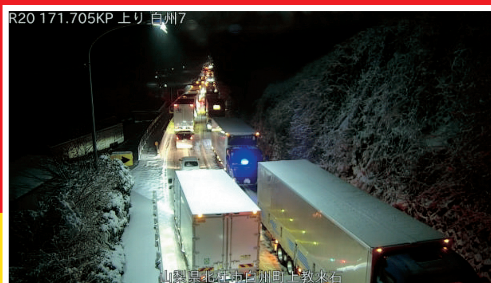
山梨県北杜市白州町上教来石