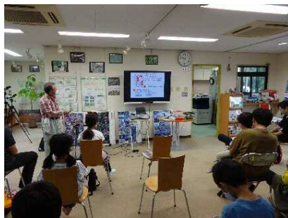
モリアオガエル観察会