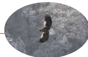
オオワシ(国の天然記念物)の飛来