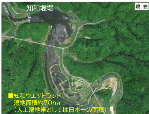
■知和ウエットランド 湿地面積約70ha (人工湿地帯としては日本一の面積)