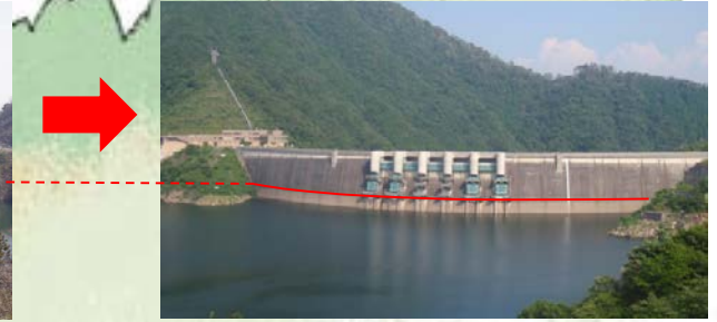
水位を低下した後のダム湖の水位