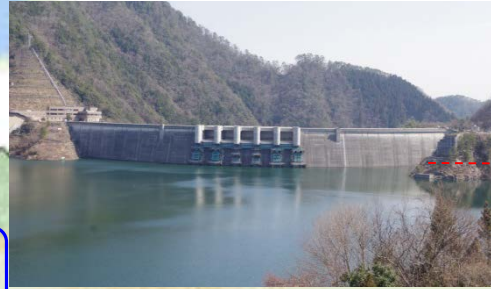
水位を低下する前のダム湖の水位