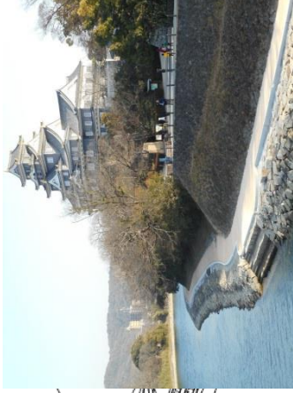
旭川右岸の河川管理用通路 (石山公園～岡山城付近)③