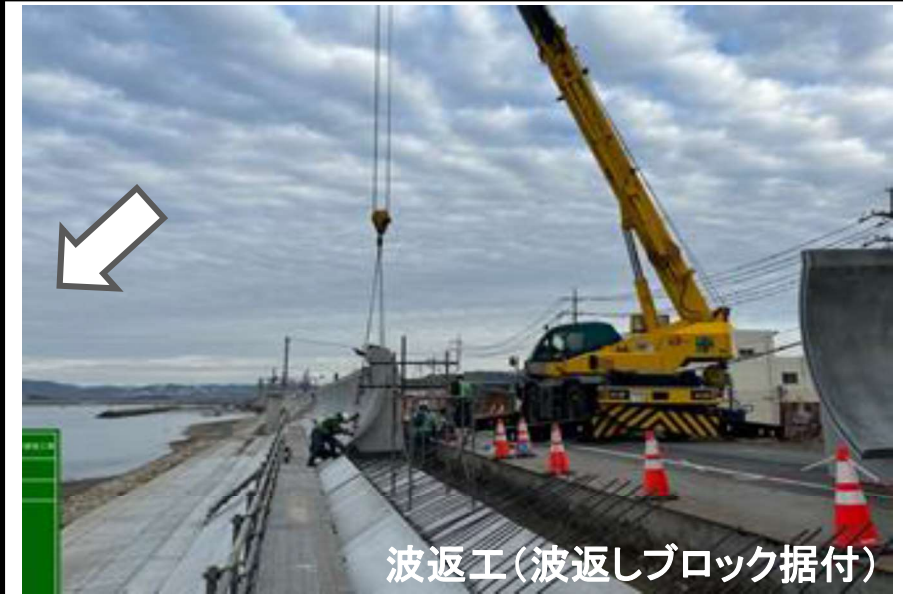
整備状況 令和5年12月