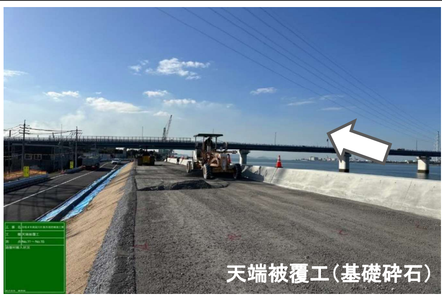
整備状況 令和6年2月