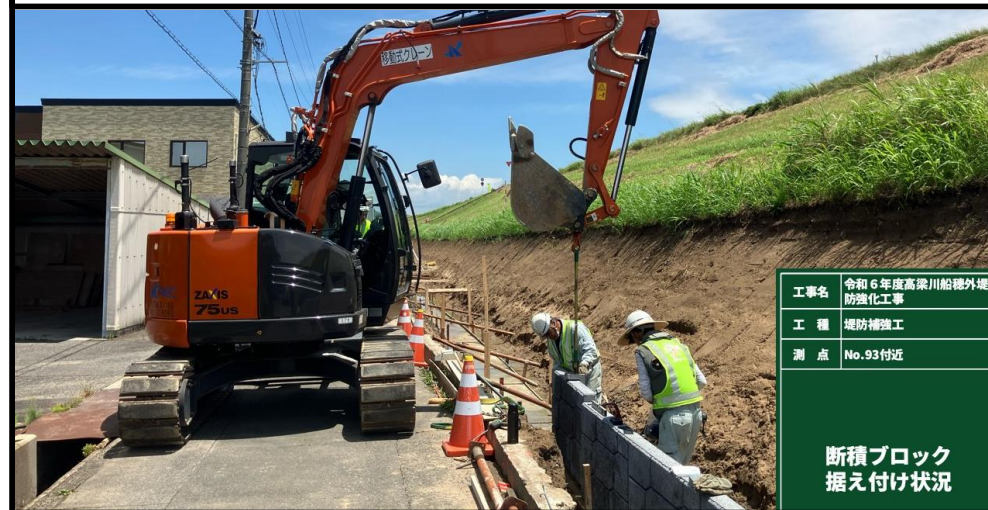
施工状況 令和7年6月