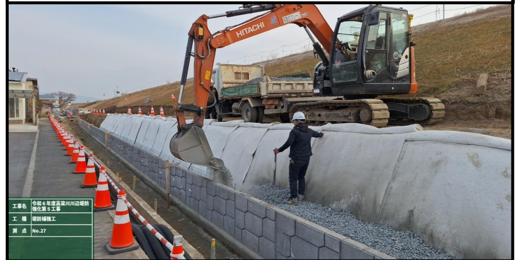
施工状況 令和8年2月