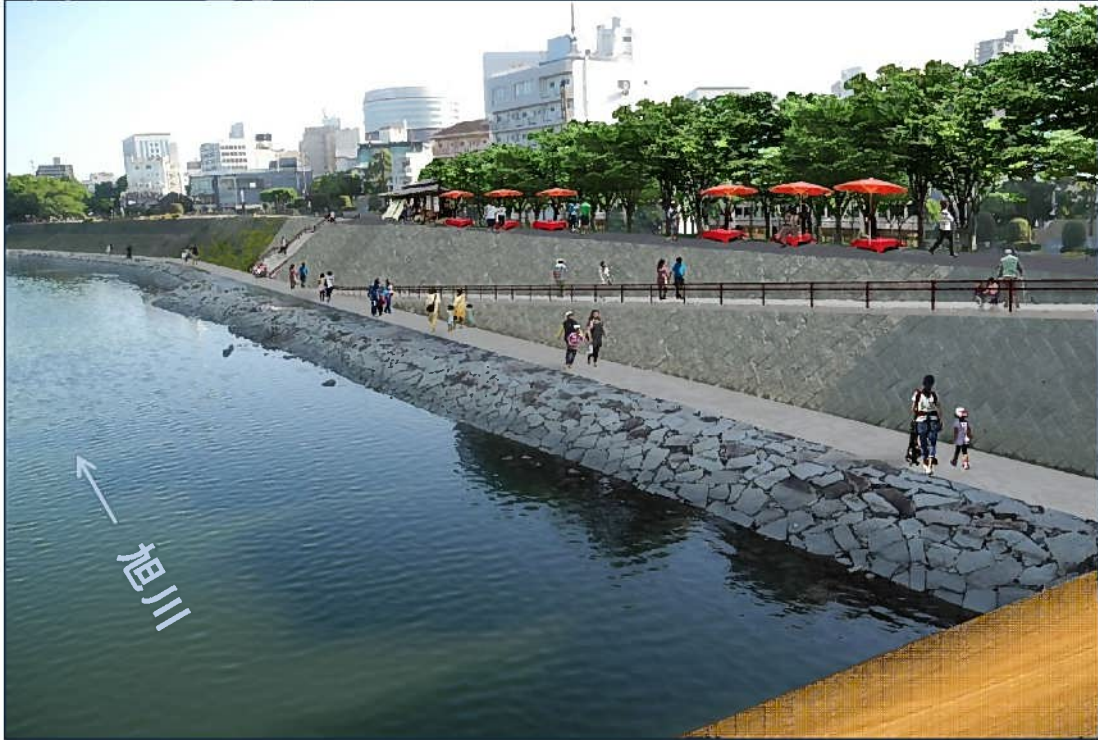
【旭川西側整備イメージ】