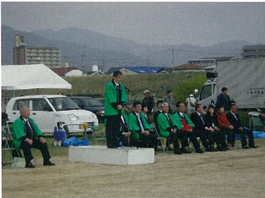
開会式事務所長挨拶