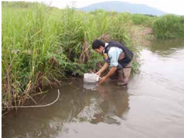
セルビン（調査地区 4）