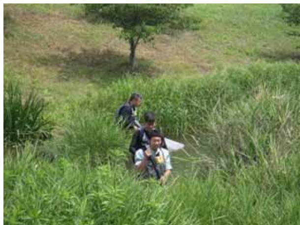
調査状況全景写真