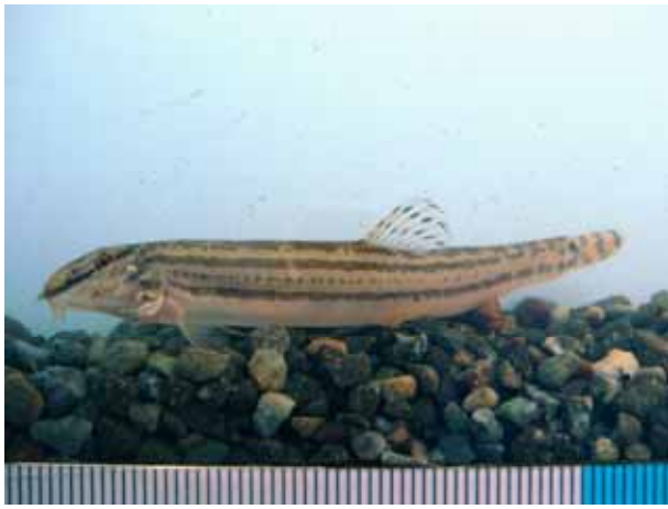
スジシマドジョウ中型種