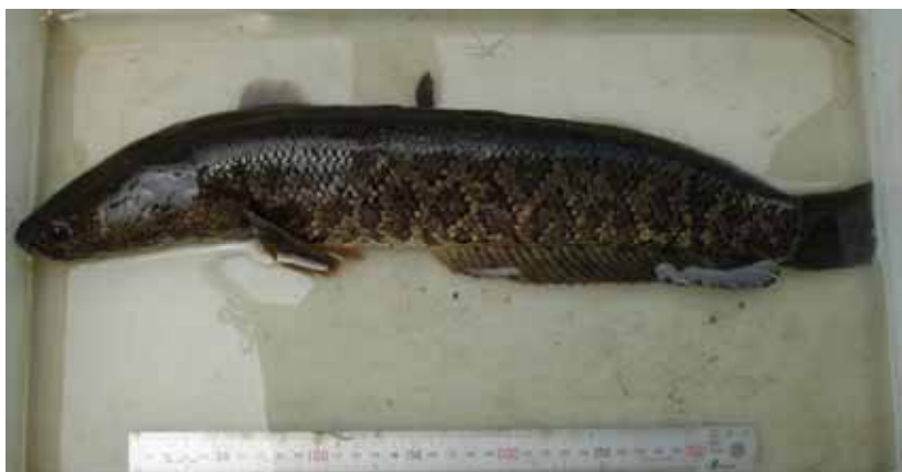
カムルチー（ライ魚）