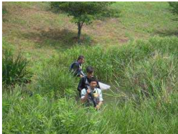
調査状況全景写真