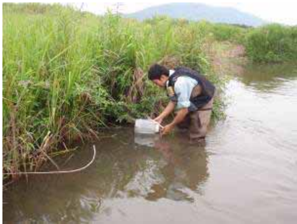
セルビン（調査地区4）