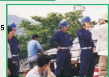
災害情報通報訓練

避難誘導・交通規制訓練・広報訓練 9:45 - 10:00 〈倉敷市立西阿知小学校(児童・保護者) 倉敷消防団・倉敷警察署〉