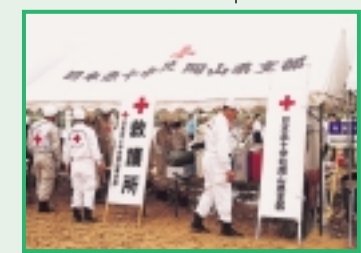
日赤救護所設置訓練