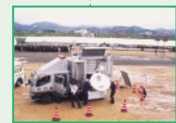
通信設備災害復旧訓練