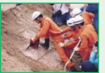
土砂災害救命訓練