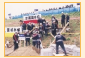
杭打ち積土のう工