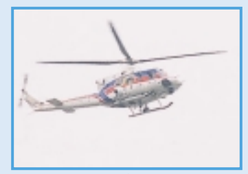
国土交通省ヘリコプター