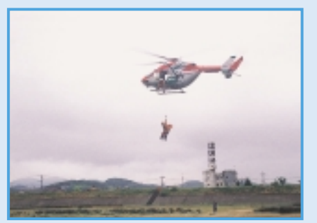
人命救助訓練(岡山市消防局)

〈岡山県警察本部・日本赤十字社岡山県支部・倉敷市消防局・岡山市消防局ヘリ・陸上自衛隊〉