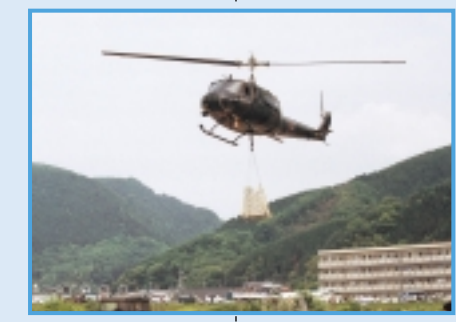
緊急物資輸送訓練