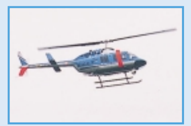
岡山県警ヘリコプター