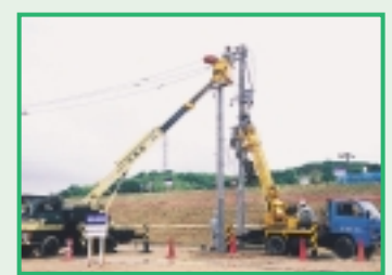
電力設備災害復旧訓練