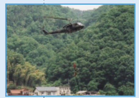
人命救助訓練(陸上自衛隊)