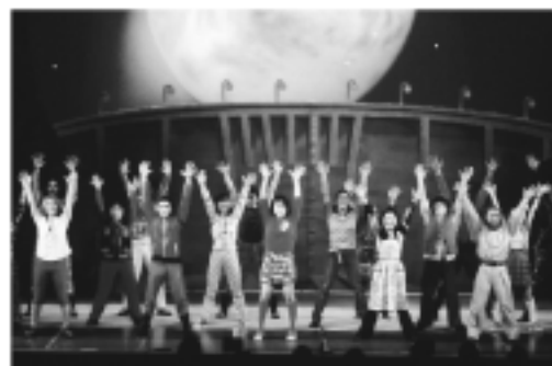
地球は水の恵と うたいあげるフィナーレ

人は水なしには1日も生きてゆけない その水はどこから来るのだろう。 毎日当たり前のように水道から流れ出る水は、 多くの人々や自然のコントロールによって 潤れることがないのである。 このものがたりは、 森と水源地と川の讃歌である。