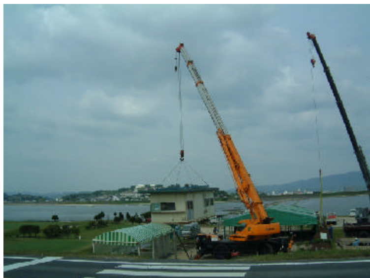
平成17年度撤去訓練の様子（高梁川左岸 霞橋ゴルフ場にて）

今年も、国土交通省が管理する吉井川（3箇所）、旭川（3箇所）、百間川（1箇所）、高梁川（7箇所）において、撤去訓練を行います。