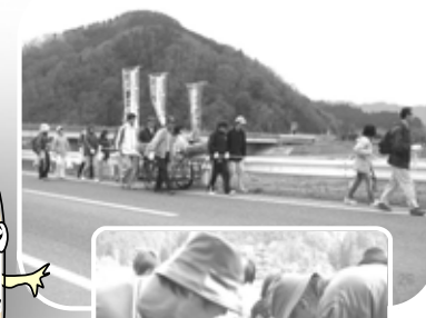
醍醐 桜の里自然体験交流会 (8/6)