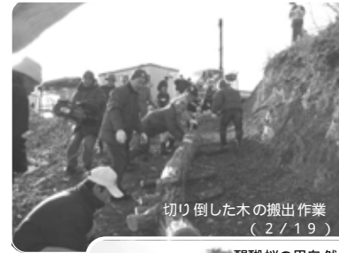
切り倒した木の搬出作業 (2/19)

そ の 他 ・この事業開催中、万一不慮の事故等が発生したときは、応急処置のほか公民館総合保障制度の範囲で処置します。 ・交流会では各地の水の特性を生かしたアルコール類の飲み比べを予定しています。地域の銘酒をぜひご提供ください。