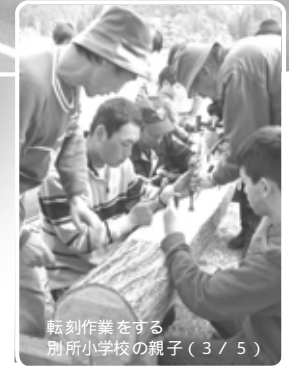
転刻作業をする 別所小学校の親子(3/5)