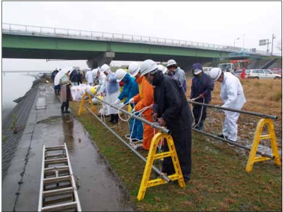
オイルフェンス展張訓練