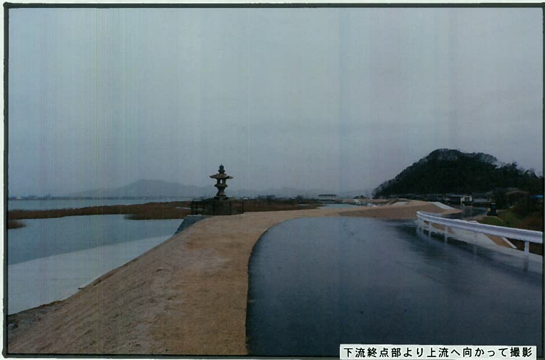
下流終点部より上流へ向かって撮影