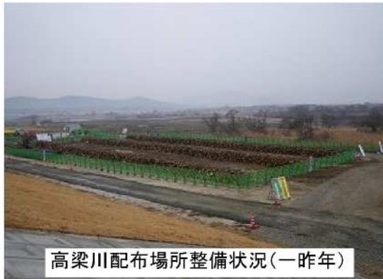
高梁川配布場所整備状況(一昨年)