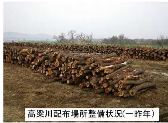
高梁川配布場所整備状況(一昨年)