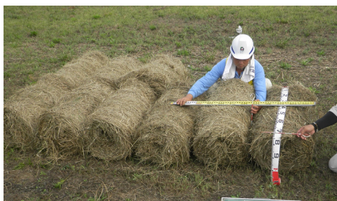
(昨年度の提供状況)