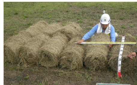
（昨年度の提供状況）

〒703-8244 岡山市中区藤原西町2-3-30 中国地方整備局 岡山河川事務所 旭川出張所 電話 086-272-0125