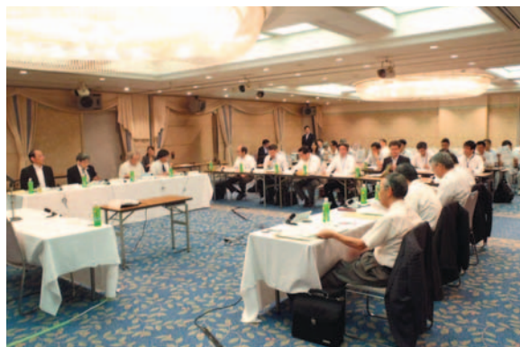
【10月3日 明日の吉井川を語る会の様子】