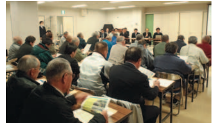
[西大寺公民館会場]

考える会では河川管理者から河川整備基本方針と河川整備計画とのちがい、および吉井川の概要と課題について説明を実施しました。