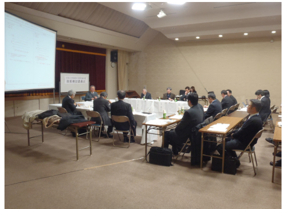
第8回 開催状況(平成26年2月7日)