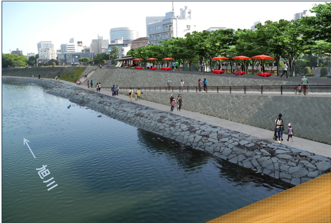
【旭川西側整備イメージ】