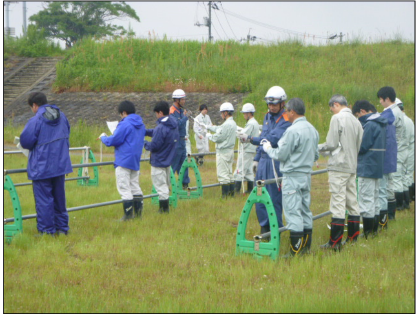
オイルフェンス展張訓練