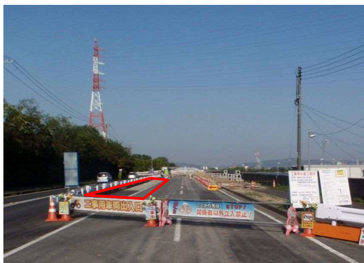
報道関係者駐車場