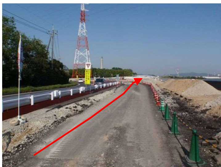
駐車場から視察箇所への順路