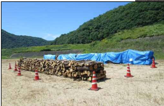
伐採木の仮置き状況