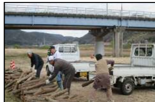
昨年度の配布状況

※現地でも、申請書を記載することができますが、事前に記載して頂くなどスムーズな提供にご協力願います。