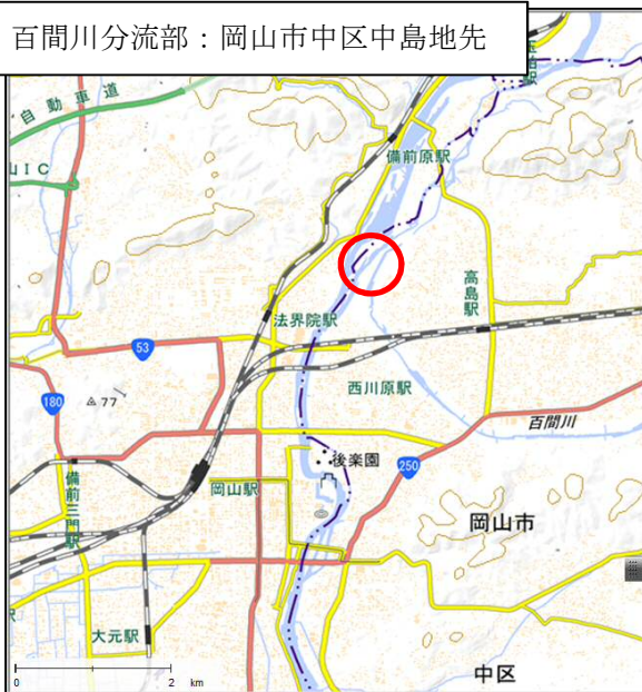
百間川分流部：岡山市中区中島地先