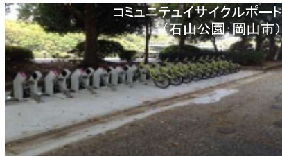
コミュニティサイクルポート (石山公園・岡山市)

③岡山後楽園・岡山城 ソフト：幻想庭園ほか ハード：コミュニティサイクルポート設置 (市)