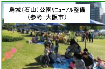
烏城(石山)公園リニューアル整備 (参考:大阪市)

②旭川右岸 城下地区 ソフト：オープンカフェほか ハード：烏城(石山)公園 リニューアル整備 (市)