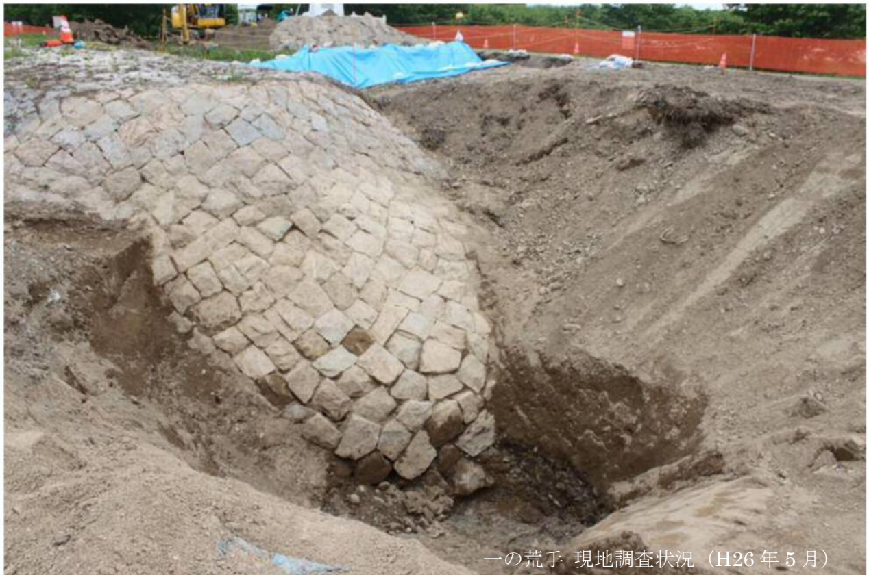
一の荒手 現地調査状況 (H26年5月)

前回調査では5m以上地下に埋設していることが新たに発見されました。 今回は深すぎて調査できなかった全体を掘り出し確認予定です。