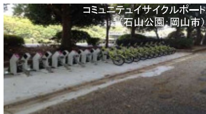
コミュニティサイクルポート (石山公園・岡山市)

③岡山後楽園・岡山城 ソフト：幻想庭園ほか ハード：コミュニティサイクルポート設置 (市)