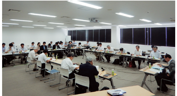
【第4回 明日の吉井川を語る会の様子】

今後も引き続き、ご意見を伺いながら、河川整備計画の策定に向けて、検討を進めていきます。