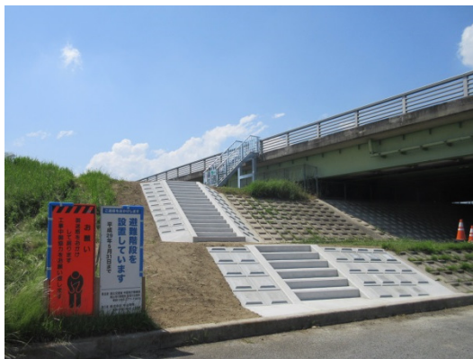
完成した避難階段（全景）