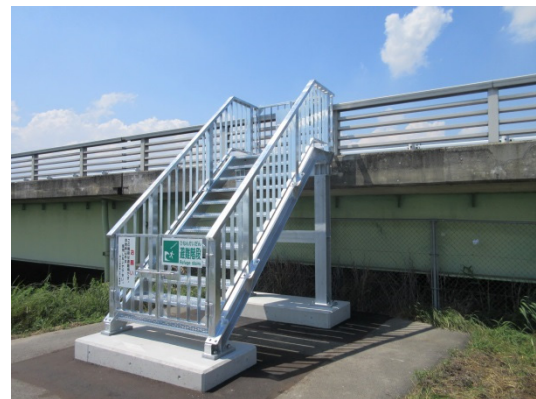
国道2号橋上への接続状況