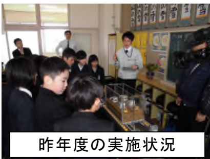
昨年度の実施状況

この度、地元の小学生（開成小学校4年生 23人）のみなさんに、災害からくらしを守る九幡地先での工事の必要性を理解していただき、防災意識を高めていただくことを目的として実施します。