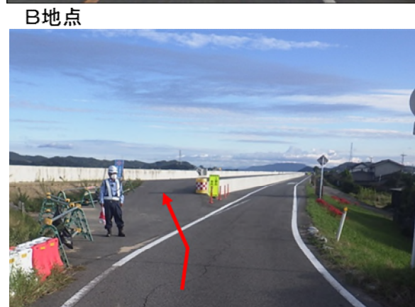
【参考】高潮耐震工事の状況（鋼矢板圧入）