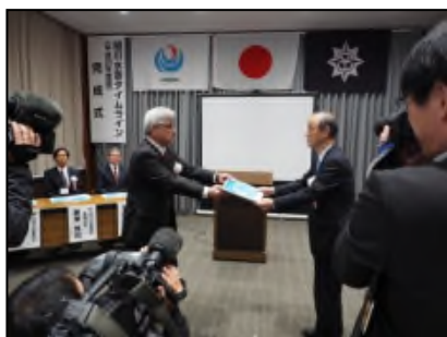
完成式状況(平成29年3月23日)