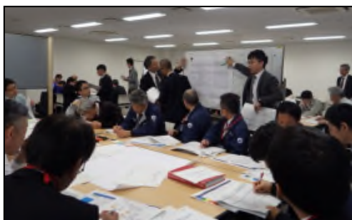
過去の検討会状況