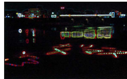
「クリスマスキャンドルの夕べ」の開催