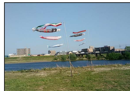
「こいのぼりを楽しむ会」の開催