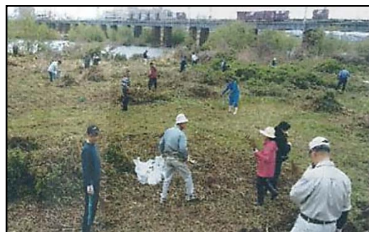
河川敷の除草・清掃