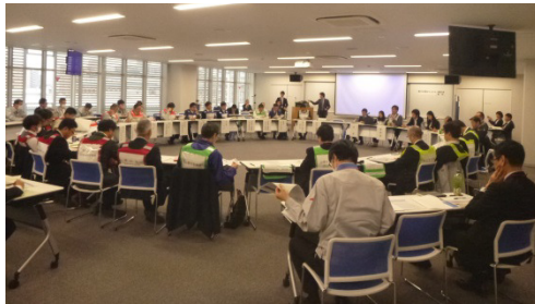
昨年度の実施状況(平成29年12月4日)