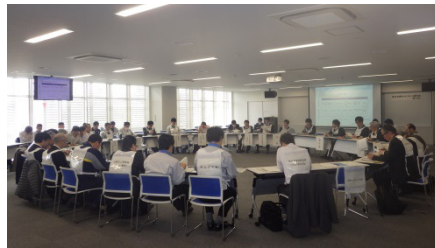
昨年度の実施状況(平成30年2月28日)