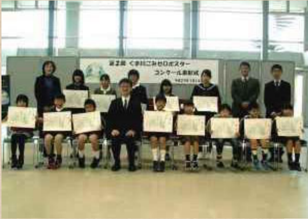
【熊本県】球磨川 次世代のためにがんばる会

河川協力団体は市民と河川管理者、双方の立場を理解し、活動しています。市民と河川管理者の間に立つことで、お互いの視点や想いを融合することが出来ます。その結果、河川の利活用や維持・管理につながります。