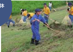
河川の除草・集草