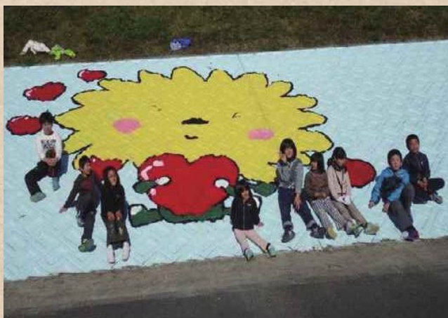
【徳島県】桑野川 横見町をきれいにする会

誰でも、いつでも気軽に近づける快適な河川空間は維持・管理が重要です。河川協力団体が実際の作業を行うにあたって、河川管理者と河川協力団体が協力して計画を作成するなど、両者が一体となって安心・安全な河川空間の維持・管理の質の向上につながっています。