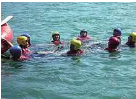
水辺の安全利用講習会

河川や河川空間を使って、観察会や、安全に河川を利用するための講習会などを実施します。