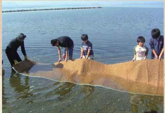
【鳥取県・島根県】中海 NPO法人 未来守りネットワーク

河川協力団体によるアマモ場再生への取り組み。作業に地域の子も達も参加することで、自分達が住む地域への関心や、自然環境に対する意識の向上につながっている。