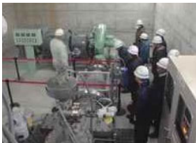
河川・ダム管理状況説明

過去の水害などの伝承や、防災に関わる活動、またダムなど河川にある施設での説明会などを実施します。