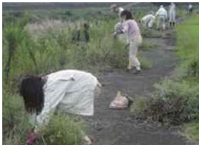
外来植物調査・駆除

水生生物の調査研究や、生態系を維持するために外来生物の駆除活動などを行い、河川環境を維持します。