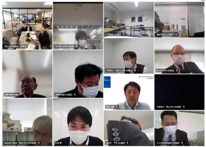
改善検討会の様子(Teams)