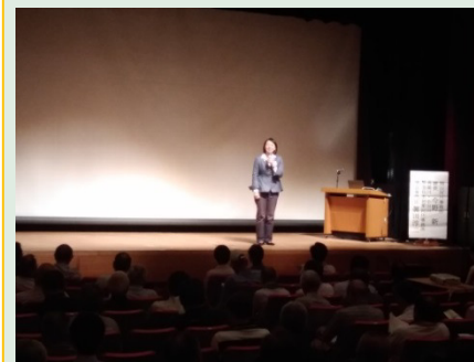
倉敷市長あいさつ