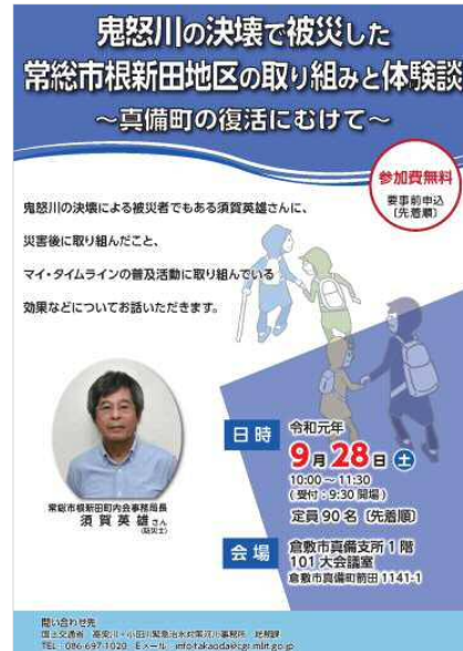
被災経験者による講演会