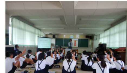
R1.10.15 倉敷市立岡田小学校