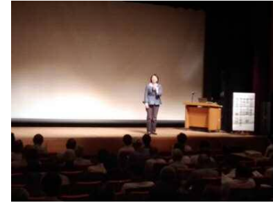
倉敷市長あいさつ