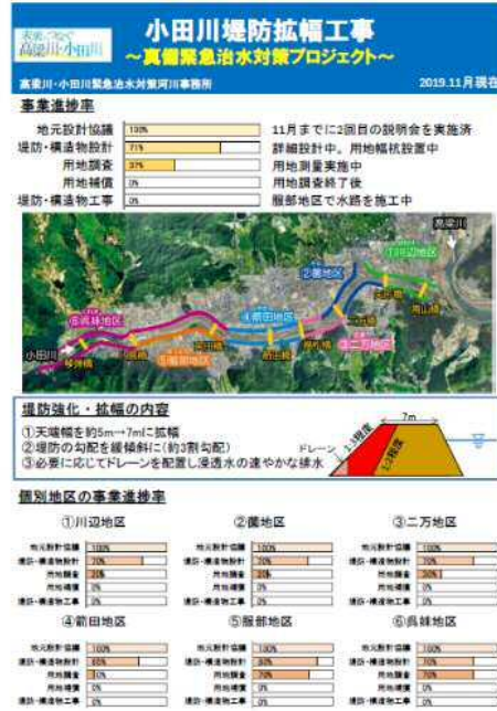
ホームページ公表資料