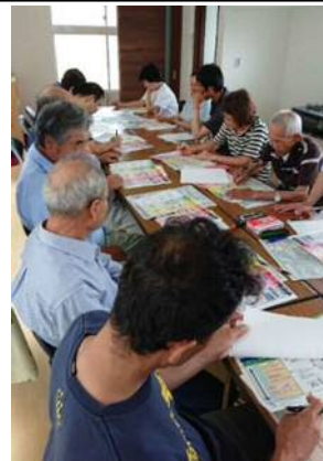
原田地区での勉強会の様子