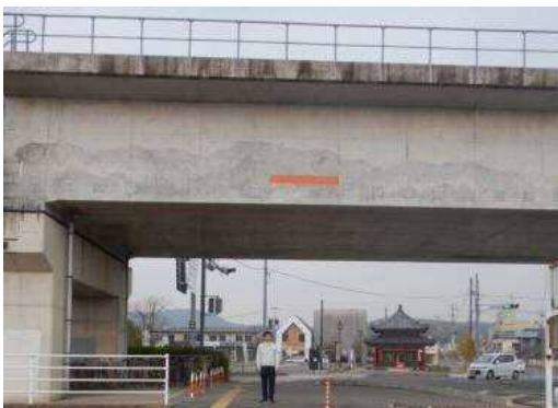
井原鉄道高架に表示したオレンジライン