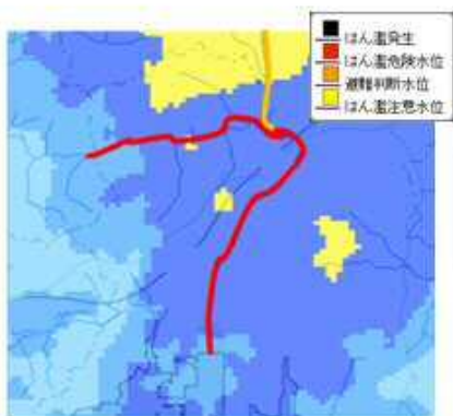
「川の防災情報」の表示例