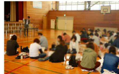
R1.10.12 倉敷市立菫小学校