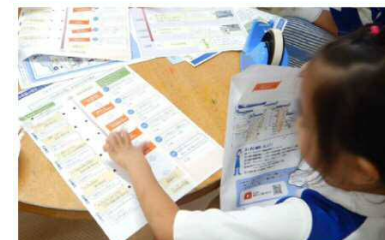
R1.10.23 倉敷市立呉妹小学校