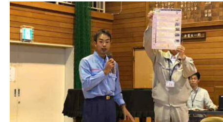
R1.10.26、27 真備地区復興懇談会