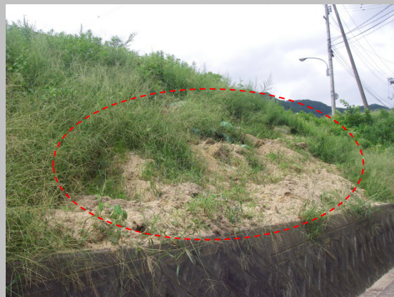
堤防の崩れ (旭川水系旭川)