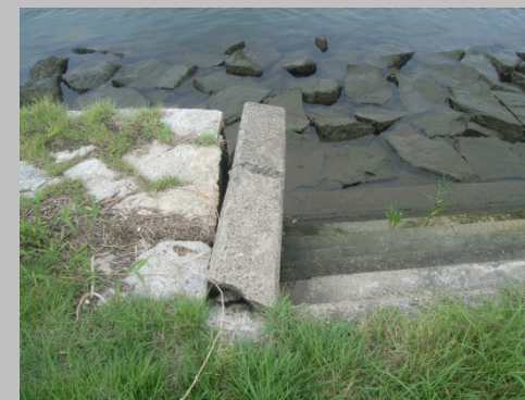
階段の欠損 (吉井川水系吉井川)