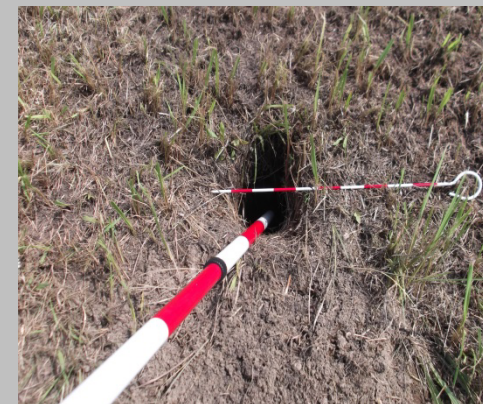
堤防にできた小動物によると思われる穴(深さ70cm程度) (吉井川水系吉井川)