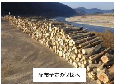
配布予定の伐採木